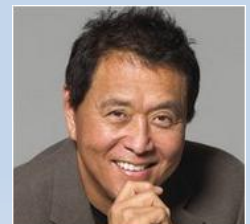
רוברט ט. קיוסאקי

נולד בשנת 1947 בהוואי (ארה"ב), והתפרסם בזכות סדרת הספרים "אבא עשיר, אבא עני", אשר נמכרו במיליוני עותקים בכל רחבי העולם.