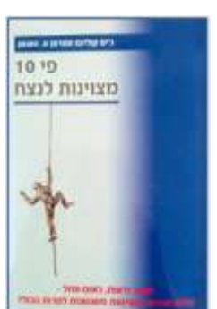
10 מצוינות לנצח ג'ק קולינס + מ. האנס לסקירה המלאה