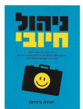
ניהול חיובי יהודה בידרמן לסקירה המלאה