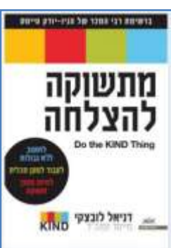
מתשוקה להצלחה דניאל לובצקי לסקירה המלאה

ספרים העוסקים במימדי הניהול האנושי - מיומנויות ניהול ומיומנויות אישיות אותן כדאי לנו לשכלל ולפתח, הן כחלק מהתפתחותנו האישית והן כחלק מתפקידנו כמנהלים, עמיתים ושותפים לפיתוח האנושי בארגון.