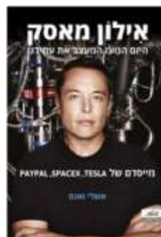
איילון מאסק אשלי ואנס לסקירה המלאה