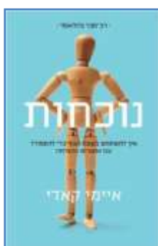
נוכחות: איך להשתמש בשפת הגוף איימי קאדי לסקירה המלאה