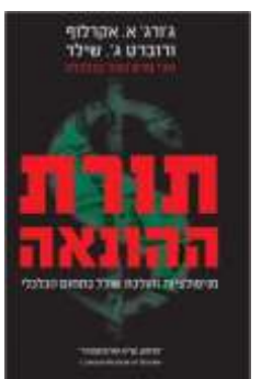
תורת ההונאה ג'ק אקרלוף + ר. שילר לסקירה המלאה