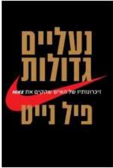
נעליים גדולות פיל נייט לסקירה המלאה

ספרים אשר נכתבו ע"י יזמים ומנהלים ומציעים הצצה מרתקת אל "אחורי הקלעים" של עולם הניהול העכשווי, תוך דגש לא רק על ההישגים וההצלחות אלא גם על הלבטים, הטעויות, הכישלונות והלקחים מהם.