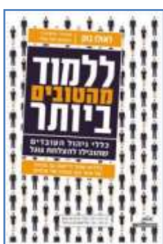
ללמוד מהטובים ביותר לאזלו בוק (מש"א גוגל) לסקירה המלאה