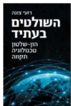
השולטים בעתיד רועי צנזה לסקירה המלאה

ספרים אשר מנתחים וחוזים את השינויים והמגמות הצפויות בעולם הארגוני, בשנים הקרובות ובטווח הרחוק, ומספקים לנו הן חומר למחשבה והן כיווני פעולה פרקטיים אליהם כדאי להיערך ולהתכונן כבר היום.