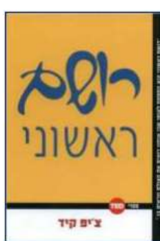
רושם ראשוני צ'פ קיד לסקירה המלאה