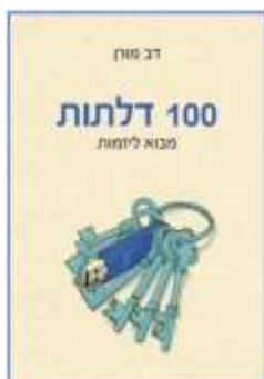
100 דלתות דב מורן לסקירה המלאה