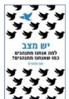
יש מצב סם סומרס לסקירה המלאה