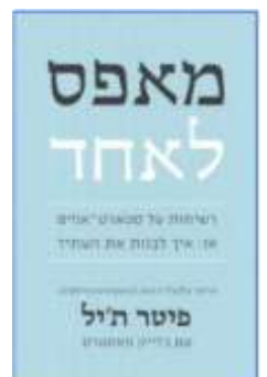
מאפס לאחד פיטר ת'יל לסקירה המלאה