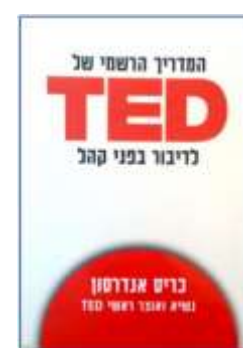
המדריך של TED כריס אנדרסון לסקירה המלאה