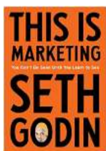
This is Marketing Seth Godin