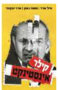
קילר אינסטינקט ארד | גאון | יעקובי