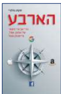
הארבע סקוט גולוויי