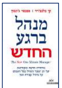
מנהל ברגע / החדש בלצ'רד | גלזסון