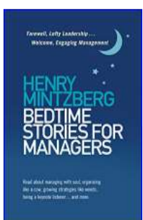
Bedtime Stories Henry Mintzberg